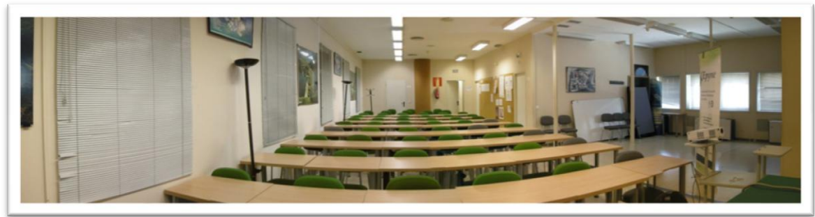
Aula magna. A la derecha se encuentra la zona de exposición.