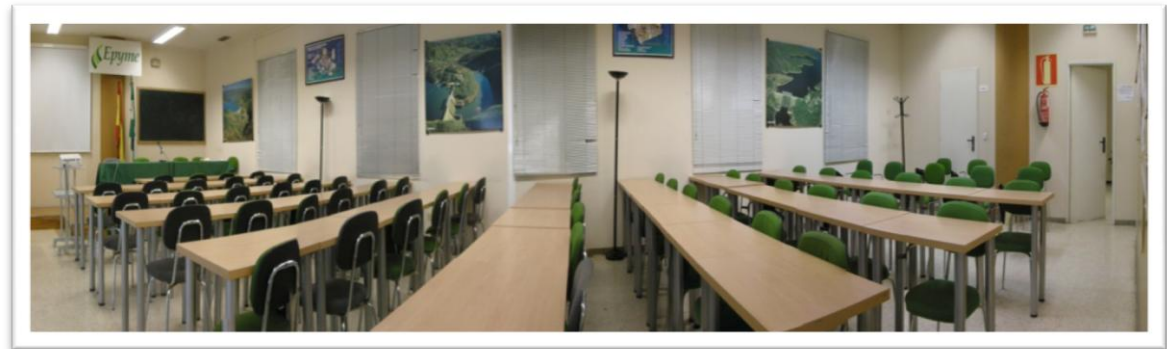
Aula magna. Vista lateral.