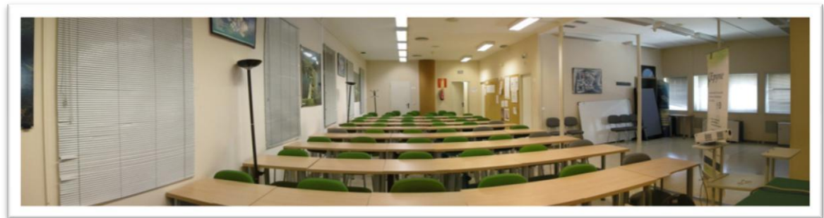
Aula magna. A la derecha se encuentra la zona de exposición.